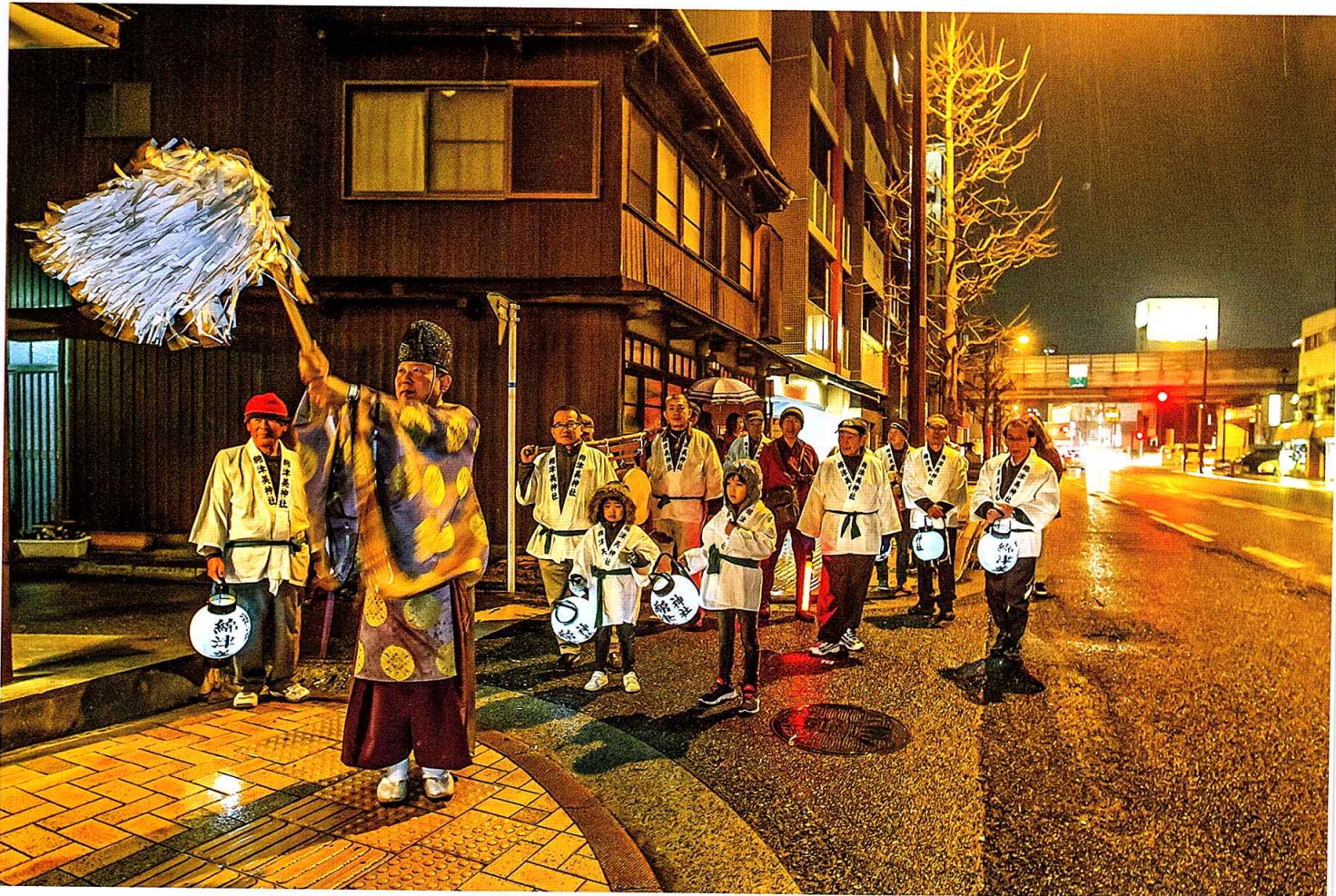
萩崎町の「わいわい祭」(小倉北区)