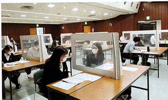
隣の受講者とも話し合いながら、ビジネス文書の作り方を確認

当会議所はビジネス文書作成セミナー（初級編）を毎日西部会館で開催、39人が受講した。